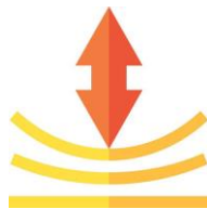
Mejorar la resiliencia operativa

Reduzca sus costos de IT trasladando la infraestructura y las aplicaciones a la nube, y libere recursos para enfocarse en lo que realmente diferencia a su negocio. Al migrar aplicaciones heredadas a la nube, puede lograr un ahorro de infraestructura promedio del 31 %.