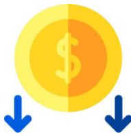
Reducir el costo

Reduzca sus costos de IT trasladando la infraestructura y las aplicaciones a la nube, y libere recursos para enfocarse en lo que realmente diferencia a su negocio. Al migrar aplicaciones heredadas a la nube, puede lograr un ahorro de infraestructura promedio del 31 %.