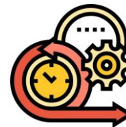
Aumentar la agilidad empresarial

Permita que sus empleados pasen del trabajo táctico al estratégico y amplíe drásticamente sus esfuerzos al reducir el tiempo dedicado a las tareas de administración del sistema. Los clientes que migren a AWS podrán ejecutar la administración de su infraestructura de IT con un 62 % más de eficiencia.