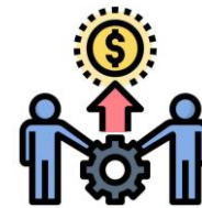
Impulsar la productividad del personal

Fortalezca su seguridad de IT y aumente la disponibilidad y confiabilidad del servicio, incluida la capacidad de responder a los niveles de demanda que cambian rápidamente. Los clientes que se trasladan a AWS desde las on-premise logran una reducción del 69 % en el tiempo no planificado de inactividad.